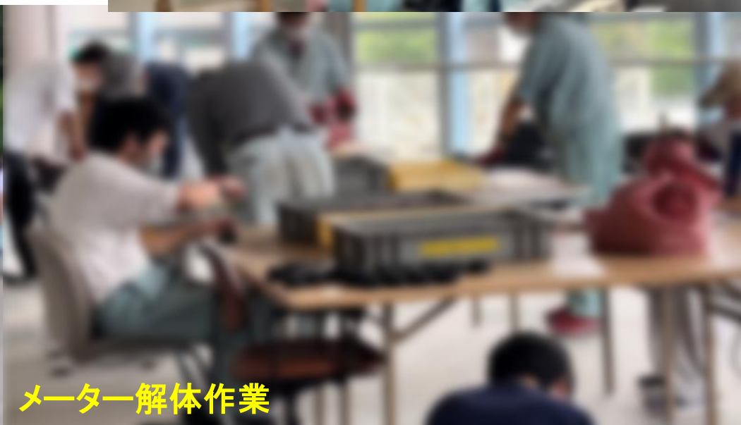
メーター解体作業